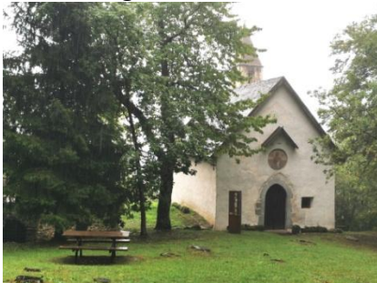
Eremo San Pancrazio

Buonconsiglio, €83 ÜFwd, Via G. Romagnosi 14/16, 0461 272 888, www.hotelbuonconsiglio.com