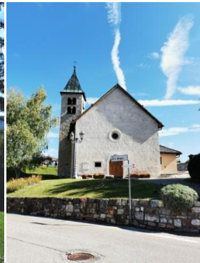
Kirche in Salter