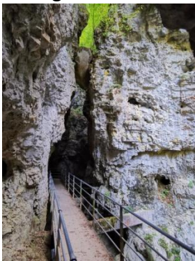
Canyon Rio Sass

Gasthof Zur Sonne Albergo, Ü½Pwd €70, Malgasott 33, 0463 859006 + 0463 885017 www.gasthofsonne.com www.albergoalsole-senale.it