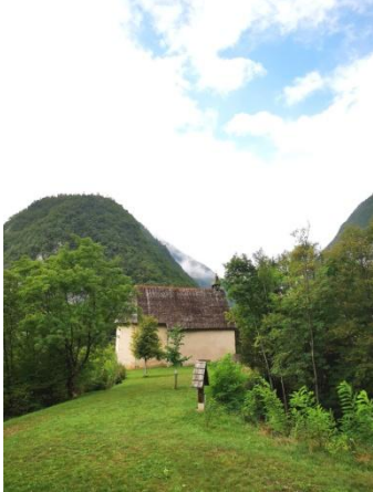
Eremo di Santa Emerenziana

B&B Casa delle Fate, €35 ÜF, Via Castel La Santa 4, 349-6847041, www.casadellefate.it