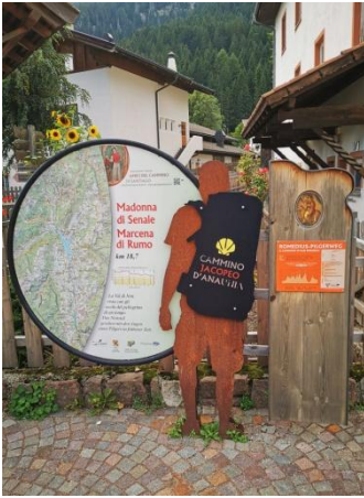
Unsere Liebe Frau im Walde/Senale