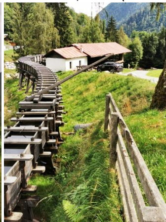
Alte Säge Segheria Veneziana