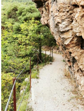
Am Weg bei Flavon