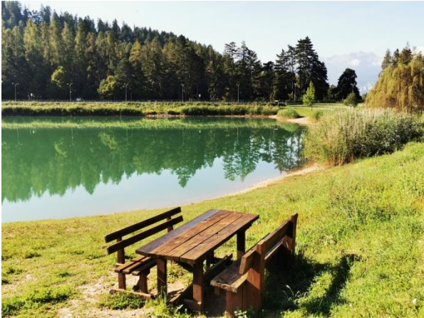
Lago di Coredo

eindrückliche Wallfahrtskirche San Romedio auf einem Felsvorsprung 99 Meter über der Schlucht. Nun geht es hinunter und über einen einzigartigen Felsenweg nach Sanzeno, wo ich in der Osteria in der Casa de Gentili zu Mittag esse. Nach dem Besuch der Märtyrerkirche laufe ich an Apfelplantagen und auf einem Wanderweg durch Wald aufwärts wieder nach Coredo. Hotel Sport, €67 ÜFwd, Via delle Antiche Fontane 6, 0463 536 108, www.hotelsportcoredo.com