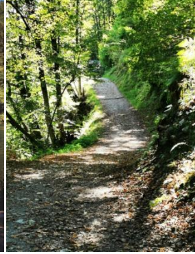
Via Claudia Augusta