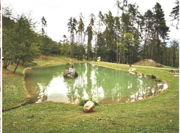
Waldpark bei Terres

FR 22.9.2023 Termon-Crescino 09:00-13:45 + Zug nach Trento 13:51-14:34