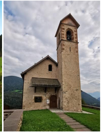
Corte Inferiore, Sant' Udalrico

SO 17.9.2023 Mocenigo-Mostizzolo 08:15-17:00 20.1 km auf 420 m ab 900 m 24.3 Lkm