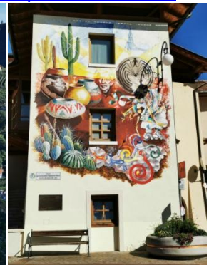
Segno, Platz Padre Eusebio Francisco Kino