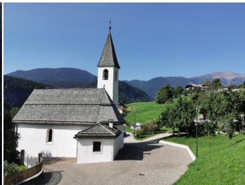
Tret, Kirche Sant' Anna