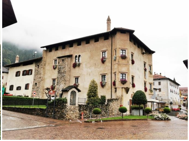
Wanderweg 1 Val di Sole