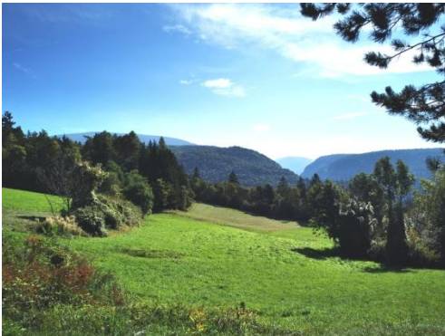
Kurz vor Salter, Blick zurück

Hotel Rosa Resort, €58 ÜFwd, Via De Zinis 31, 0463 850080 (via www.booking.com )