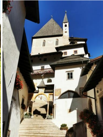
Wallfahrtskirche San Romedio