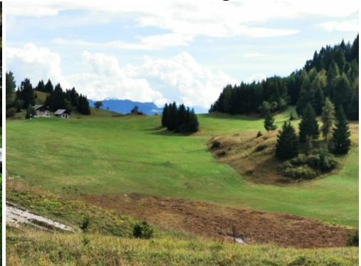
Blick zurück auf Caldes + Terzolas