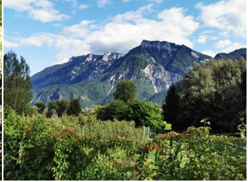
Zwischen Levico und Caldonazzo