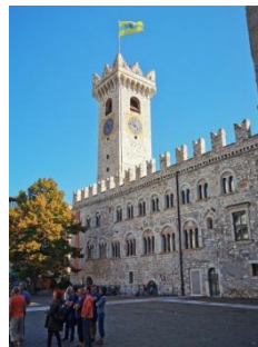
Trento, Palazzo Pretorio

Municipio 2, 0461 723 113, www.albergoduespade.it